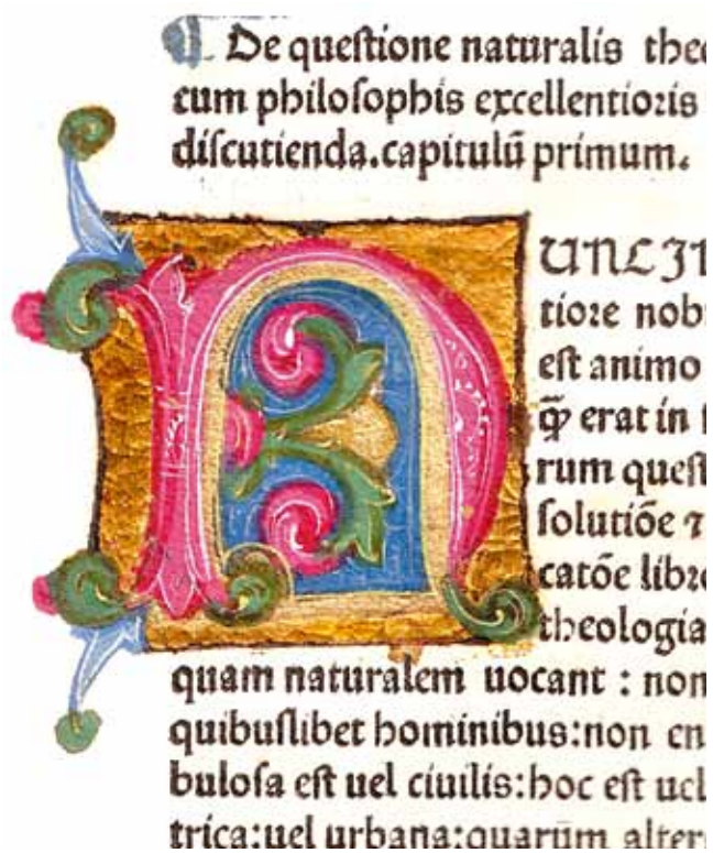
8. Sv. Aurelije Augustin, O državi Božjoj ( De Civitatis Dei ; Venecija, N. Jenson, 1475., Samostan Sv. Duje, Kraj, Ink. 4), inicijal „N” na f. 91r

St Augustine, The City of God (De Civitate Dei; Venice, N. Jenson, 1475, Monastery of St Dominus, Kraj, Ink. 4), initial N on f. 91r