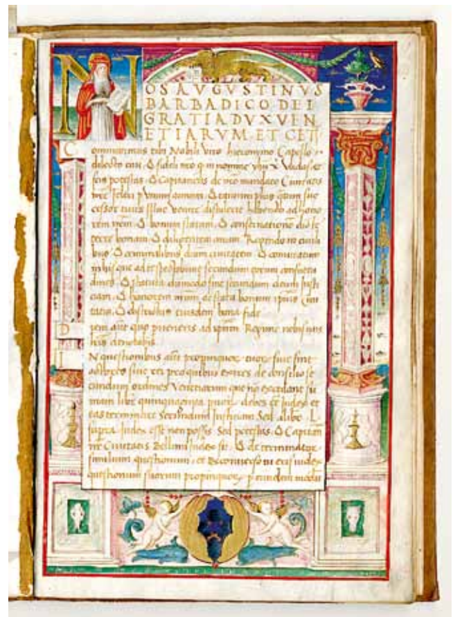
15. Commissione del doge Agostino Barbarigo a Girolamo Capello , 1487., Venecija, Bib. Del Museo Correr, MS Cl. III. 33 (izvor: www.nuovabibliotecamanoscritta.it; preuzeto: 14. prosinca 2013.)

Budući da, kako je primijetila L. Armstrong, Maestro di Pico pri oblikovanju ljudskih likova i putta tijekom čitave karijere primjenjuje istu tipologiju i stil, usporedbe se mogu pronaći i u brojnim figuralnim minijaturama iz drugih razdoblja majstorove karijere. Lijep primjer za usporedbu je i Biblia Latina (Franciscus Renner & Nicolaus de Frankfordia, 1475., Dallas, Texas, Southern Methodist University, Bridwell Library) 29 jer ima naslovnu stranicu oblikovanu na sličan način kao inkunabula iz Kraja (sl. 14). Dekorativni okvir ispunjen