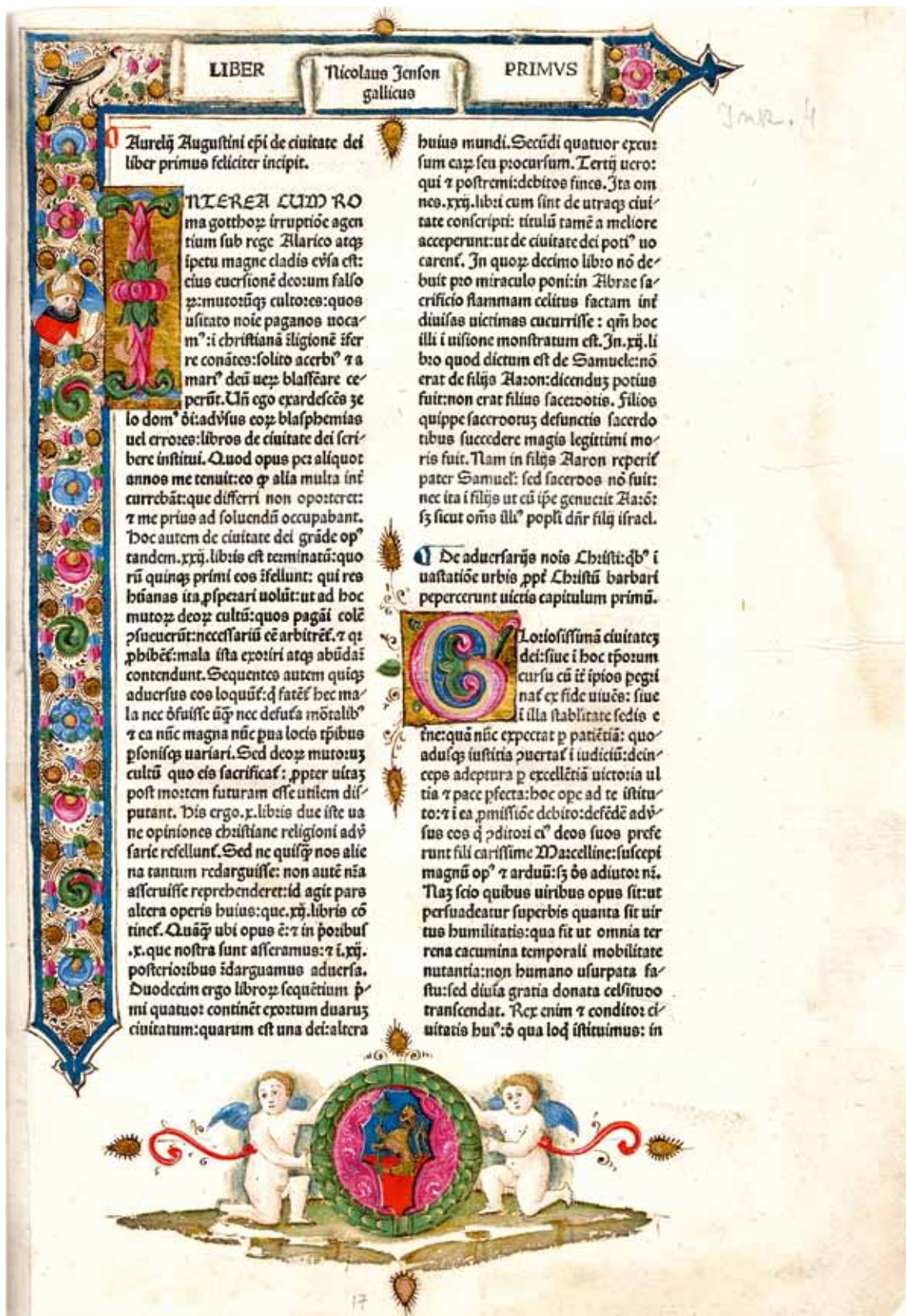
1. Sv. Aurelije Augustin, O državi Božjoj (De Civitatis Dei; Venecija, N. Jenson, 1475., Samostan Sv. Duje, Kraj, Ink. 4), f. 17r St Augustine, The City of God (De Civitate Dei; Venice, N. Jenson, 1475, Monastery of St Domnius, Kraj, Ink. 4), f. 17