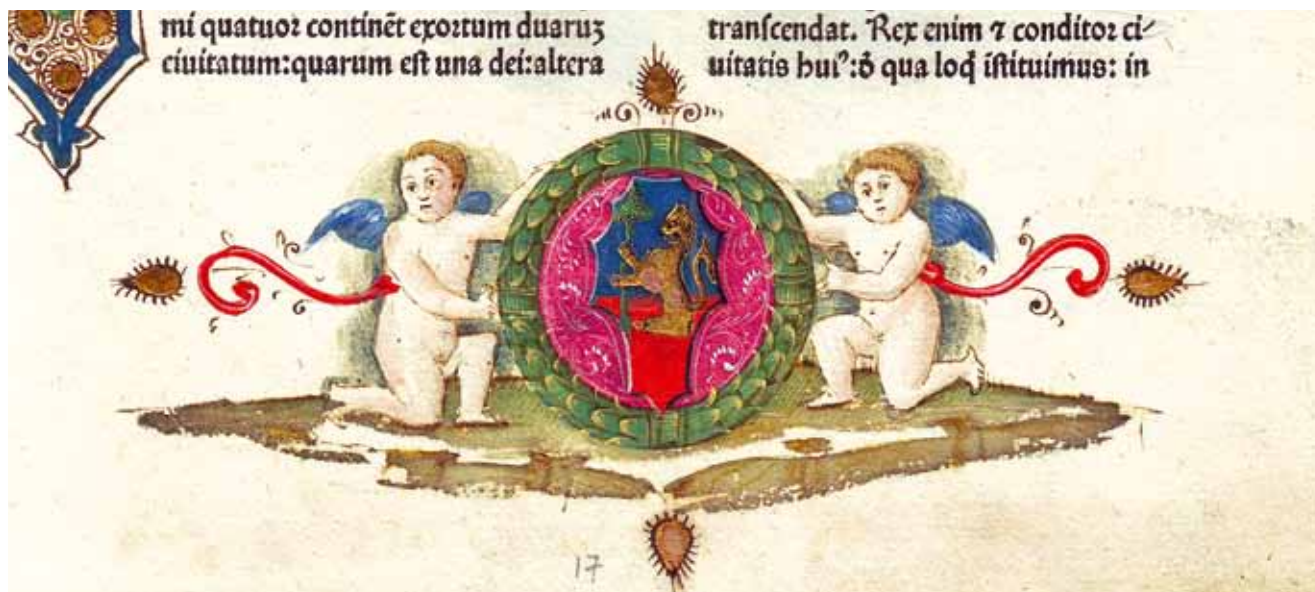
4. Sv. Aurelije Augustin, O državi Božjoj ( De Civitatis Dei ; Venecija, N. Jenson, 1475., Samostan Sv. Duje, Kraj, Ink. 4), f. 17r, detalj St Augustine, The City of God ( De Civitate Dei ; Venice, N. Jenson, 1475, Monastery of St Dominus, Kraj, Ink. 4), f. 17, detail