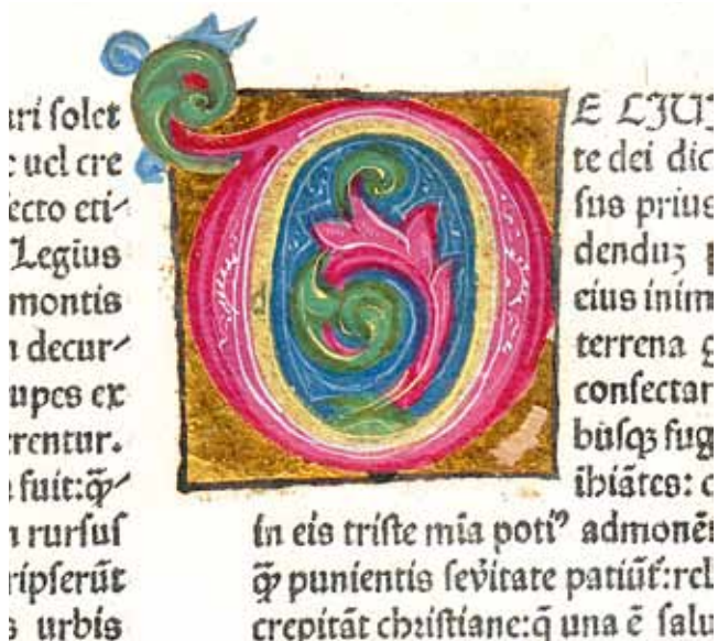
6. Sv. Aurelije Augustin, O državi Božjoj ( De Civitatis Dei ; Venecija, N. Jenson, 1475., Samostan Sv. Duje, Kraj, Ink. 4), inicijal „D” na f. 49v

St Augustine, The City of God (De Civitate Dei; Venice, N. Jenson, 1475, Monastery of St Dominus, Kraj, Ink. 4), initial D on f. 49v