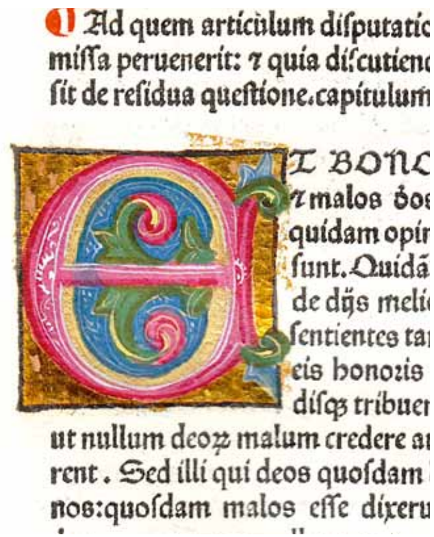
9. Sv. Aurelije Augustin, O državi Božjoj ( De Civitatis Dei ; Venecija, N. Jenson, 1475., Samostan Sv. Duje, Kraj, Ink. 4), inicijal „E” na f. 103r

St Augustine, The City of God (De Civitate Dei; Venice, N. Jenson, 1475, Monastery of St Dominus, Kraj, Ink. 4), initial N on f. 91r