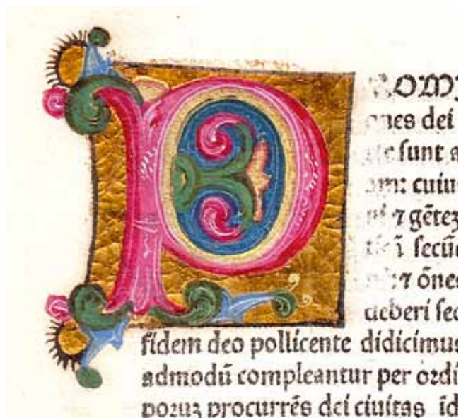
11. Sv. Aurelije Augustin, O državi Božjoj ( De Civitatis Dei ; Venecija, N. Jenson, 1475., Samostan Sv. Duje, Kraj, Ink. 4), inicijal „P” na f. 202v

U nastojanju da opus Maestra di Pico temeljito prouči sa svih gledišta Lilian Armstrong je, na temelju majstorova ključnog djela – dekoracija Plinijeve Naturalis Historia (1481.) – najprije definirala tehničke i stilske osobine njegova slikarskog rukopisa. One su joj poslužile kao polazište za daljnje atribucije, grupiranje i kronološko nizanje ostalih minijatura. Okvirno je utvrdila kako je majstor kompozicije najprije skicirao olovnom olovkom, a potom ih nanovo prelazio smeđom tintom. Scene su poslije obojane akvarelom i temperom. Pozlata je korištena ponajviše za inicijale kao i za poneki dekorativni detalj. Načelno je uočila da njegovi ljudski likovi imaju izražene podočnjake i vretenaste izdužene prste na rukama. Putti su nježni, imaju male zaobljene glave, poluzatvorene oči i svijetlu kosu oblikovanu u pramenove. Raspon upotrebljvanih boja raznolik je kao i renesansni dekorativni motivi. Zaključila je da je majstor bio briljantan kolorist, ali nikada i vrhunski crtač. Takve karakteristike uočavamo i na iluminacijama inkunabule iz Kraja. U