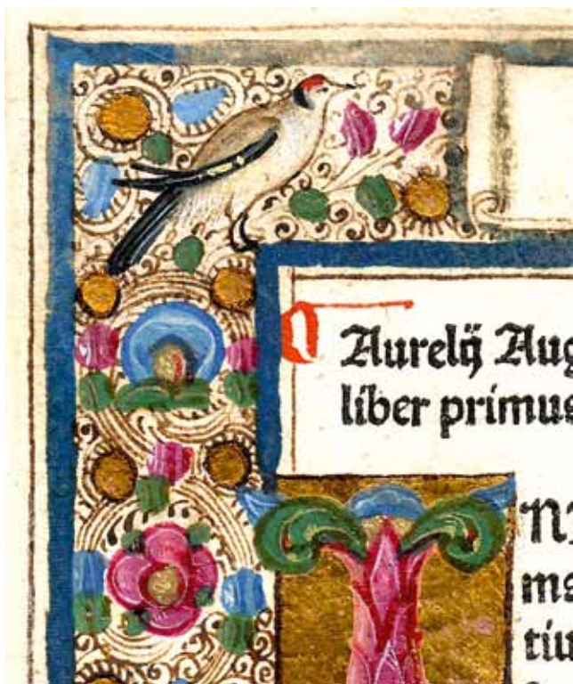
2. Sv. Aurelije Augustin, O državi Božjoj ( De Civitatis Dei ; Venecija, N. Jenson, 1475., Samostan Sv. Duje, Kraj, Ink. 4), f. 17r, detalj St Augustine, The City of God ( De Civitate Dei ; Venice, N. Jenson, 1475, Monastery of St Domnius, Kraj, Ink. 4), f. 17, detail

Dekorativan ornamentirani okvir (227 x 152 x 19 mm), obrubljen plavom trakom i tankom linijom crne boje iscrtanom s vanjske strane, ispunjava gornju i lijevu marginu početne stranice. Okvir se na krajevima sužava, a zaključen je trolistima. Osnovu dekoracije čini traka sastavljena od pet tankih linija koja se spiralno povija i tvori kružnice koje su ispunjene cvjetovima, listovima i bobicama u plavoj, zelenoj i boji ciklame te stiliziranim zlatnim cvjetovima čička. Slobodne površine iscrtanе su zavojitim viticama. U gornjem lijevom uglu okvira naslikan je češljugar 10 u desnom profilu (sl. 2). Na mjestu gdje započinje tekst lijevog stupca naslikan je unutar pravokutna polja na zlatnoj pozadini inicijal „I”, sastavljen od fitomorfnih motiva plave, zelene i boje ciklame s osjenčanjima koja su izvedena u različitim nijansama od tamnije do sasvim bijele. Unutar dekorativnog okvira, na sredini visine inicijala, nalazi se medaljon (promjer medaljona iznosi 16 mm) unutar kojeg je naslikano poprsje Sv. Aurelija Augustina, smješteno u otvoren prostor s nebom i izduženim bijelim oblacima bez drugih detalja (sl. 3). Dojam dubine prostora postignut je postupnim tonskim gradacijama neba od tamnijih u vrhu prema svjetlijim