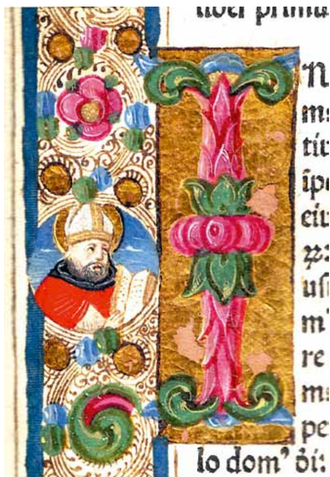
3. Sv. Aurelije Augustin, O državi Božjoj ( De Civitatis Dei ; Venecija, N. Jenson, 1475., Samostan Sv. Duje, Kraj, Ink. 4), f. 17r, detalj St Augustine, The City of God ( De Civitate Dei ; Venice, N. Jenson, 1475, Monastery of St Domnius, Kraj, Ink. 4), f. 17, detail

nijansama plave boje u donjem dijelu. Svetac je odjeven u bijelu halju i crven plašt s crnom kapuljačom. Na glavi ima bijelu mitru s ukrštenim trakama koje su ukrašene zlatnim prahom. Sjene i pregibi na odjeći naznačeni su crnim i bijelim linijama. U visini grudi naslikana je knjiga otvorenih stranica na koju pokazuje izduženim tankim prstima desne ruke. Iza svečeve glave naslikana je zlatna aureola s lijeve strane obrubljena bijelom, a s desne crnom linijom. Svetac je pogled usmjerio uvis. Na svečevoj glavi ističu se okrugle oči izraženih bjeloočnica, malen nos, zasjenjeni podočnjaci te lučno nacrtane obrve koje se prema vani stanjuju kao i prema dolje povijena usta. Volumen lica i inkarnat dodatno su naglašeni nijansama bijele i ružičaste. Kratka tamna brada oblikovana je kratkim crtama u svjetlijim i tamnijim nijansama. Dekorativan ornamentirani okvir koji ispunjava gornju marginu ukrašen je na jednak način kao i onaj uz desnu, ali skromnije jer je