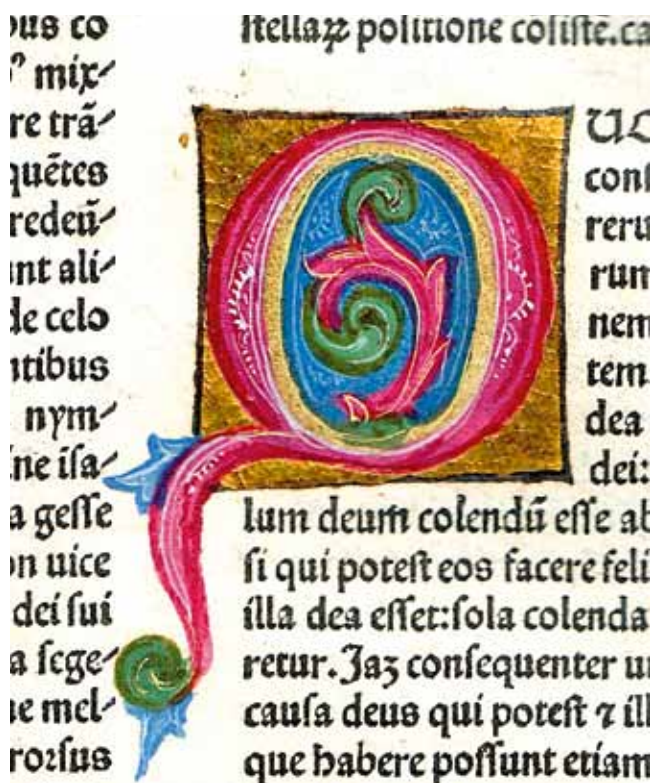
7. Sv. Aurelije Augustin, O državi Božjoj ( De Civitatis Dei ; Venecija, N. Jenson, 1475., Samostan Sv. Duje, Kraj, Ink. 4), inicijal „Q” na f. 60r

Usporedbom minijatura kojima je ukrašena inkunabula iz Kraja s kritički obrađenim korpusom venecijanske renesansne minijature može se zaključiti da one pokazuju izrazitu sličnost s brojnim radovima koji se u literaturi povezuju s minijaturistom poznatim kao Maestro del Plinio di Giovanni Pico della Mirandola ( Maestro del Plinio di Pico ili skraćeno Maestro di Pico ; aktivan od oko 1460. do oko 1505.). Ime je dobio prema svojem najpoznatijem djelu – minijaturama kojima je ukrasio rukopis Naturalis Historia Plinija Starijeg (Venezia, Biblioteca Marciana, Cod. Lat. VI,