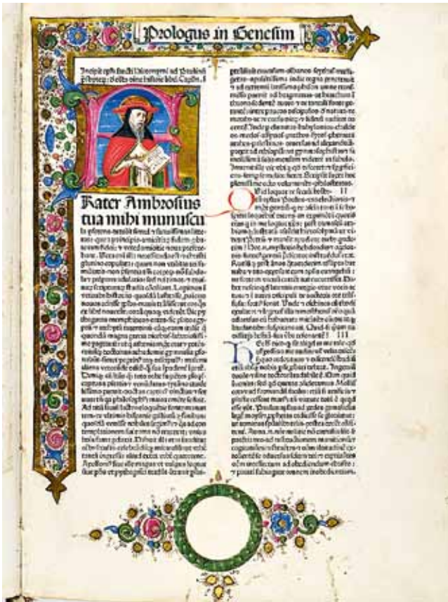
14. Biblia Latina , Franciscus Renner & Nicolaus de Frankfordia, 1475., Dallas, Texas, Southern Methodist University, Bridwell Library