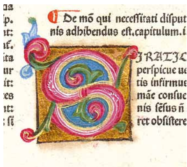
5. Sv. Aurelije Augustin, O državi Božjoj ( De Civitatis Dei ; Venecija, N. Jenson, 1475., Samostan Sv. Duje, Kraj, Ink. 4), inicijal „S” na f. 27v

Drugi je stupac početne stranice ukrašen inicijalom „G”. Njime započinje prva knjiga ( liber primus ) djela „O državi Božjoj”. Inicijal je sastavljen od fitomorfnihih motiva plave, zelene, žute i boje ciklame s osjenčanjima izvedenim u različitim nijansama i žutoj boji kako bi